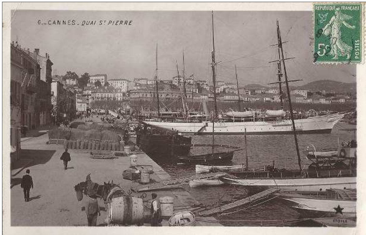
Liliane CORBIN née GALLIANO (août 2013)