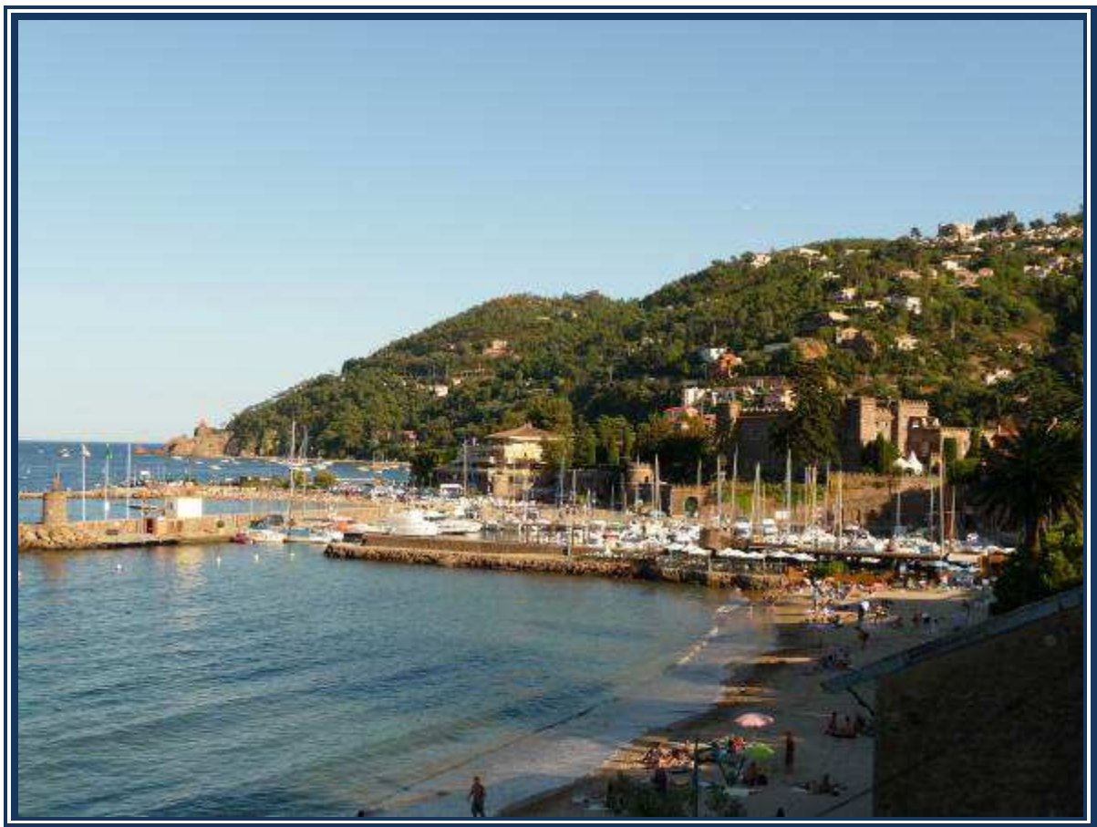
Théoule – Juin 2013